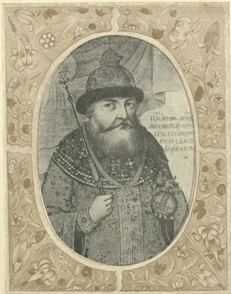
Царь и Великій Князь Михаилъ Феодоровичъ, всѣя великія Россіи самодержецъ.