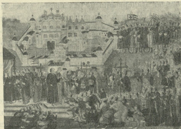
Московское посольство у Ипатьевского монастыря.

Незадолго передъ тѣмъ жизнь Михаила Теодоро- вича подверглась опасности отъ польскихъ и литов- скихъ людей, которые искали случая извести его. Кресть- янинъ села Домнина Иванъ Сусанинъ, къ которому они обратились съ требованіемъ показать дорогу въ усадьбу Романовыхъ, догадался объ ихъ зломъ умыслѣ и завелъ непрошенныхъ гостей въ непроходимый лѣсъ,