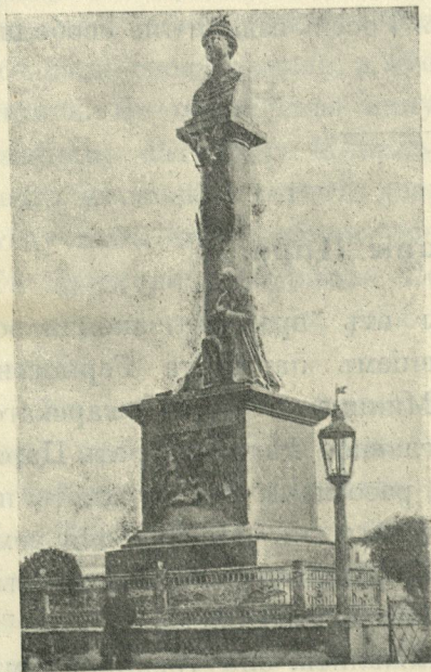
Памятникъ Ивану Сусанину.

Къ 7 февраля соборъ, столь бурный вначалѣ, окончился въ мирѣ и единеніи. Въ этотъ день соборъ „яко едиными усты“ нарекъ Царемъ Михаила. Однако, соборъ разослалъ еще по городамъ вѣрныхъ людей изъ