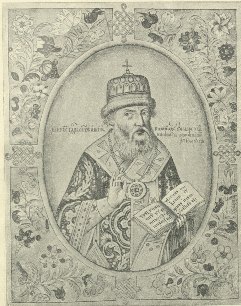
Отецъ Михаила Теодоровича, патриархъ Филаретъ, въ міру бояринъ Теодоръ Никитичъ Романовъ.