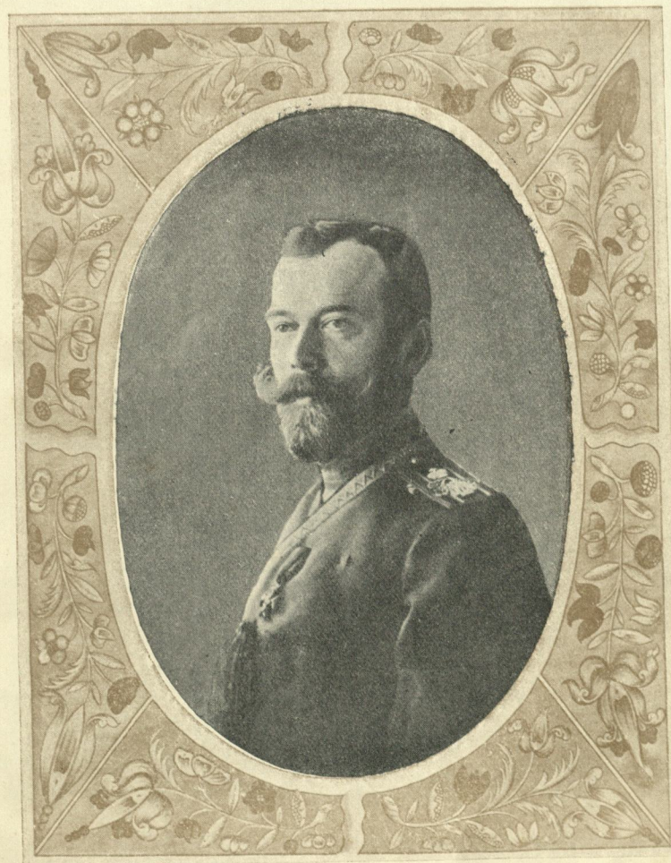
Его Императорское Величество Государь Императоръ Николай II Самодержецъ Всероссійскій.