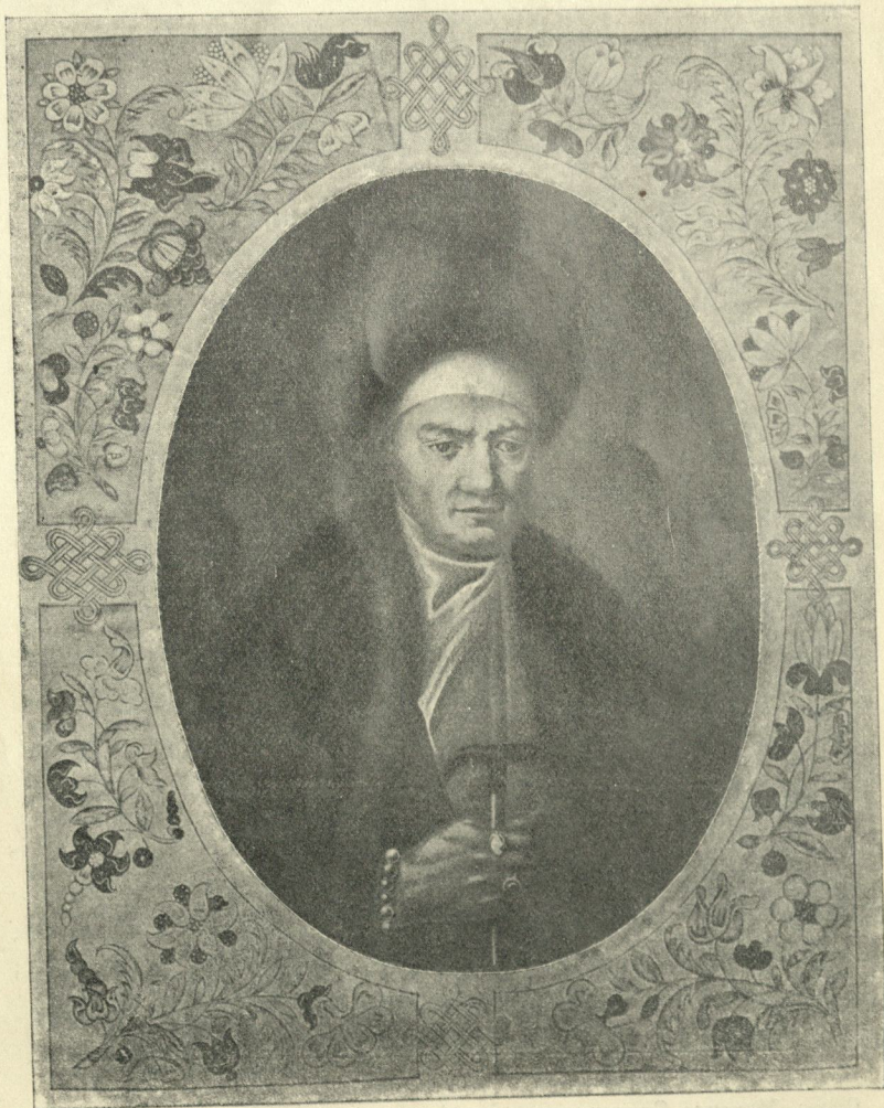
Мать Михаила Феодоровича, великая инокиня Марфа Иоанновна.